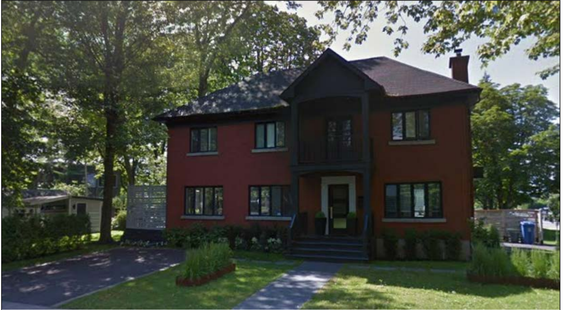
Photo du bâtiment existant