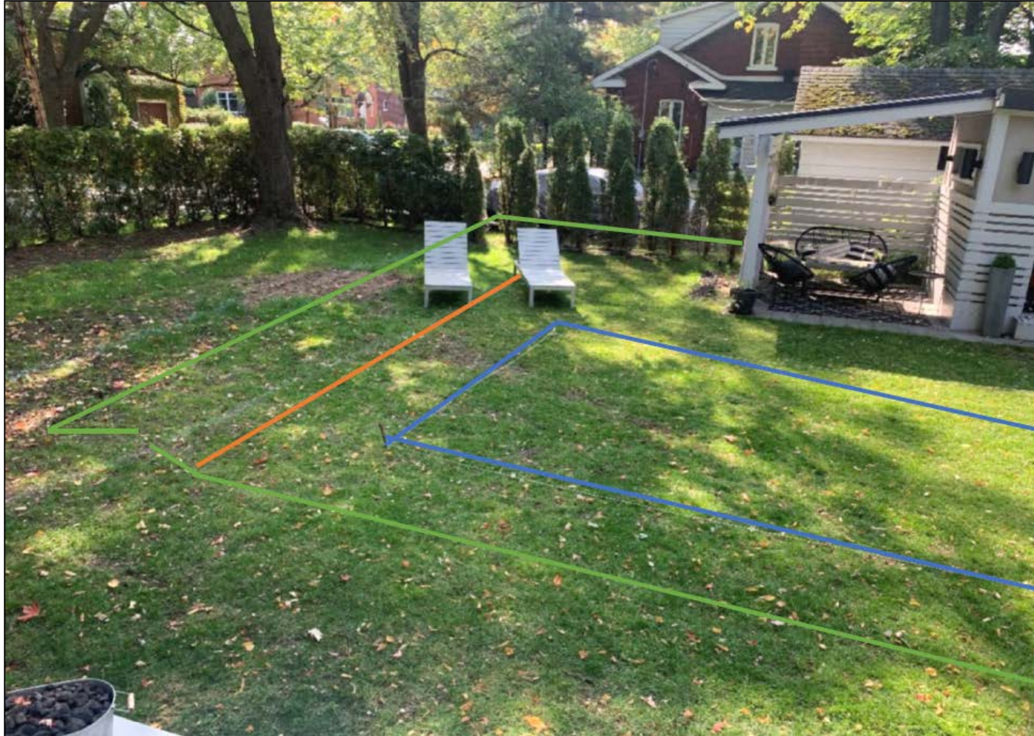
Vue de l'espace entre ce qui est actuellement permis (ligne orange) et l'endroit où il est proposé d'installer la clôture (ligne verte)