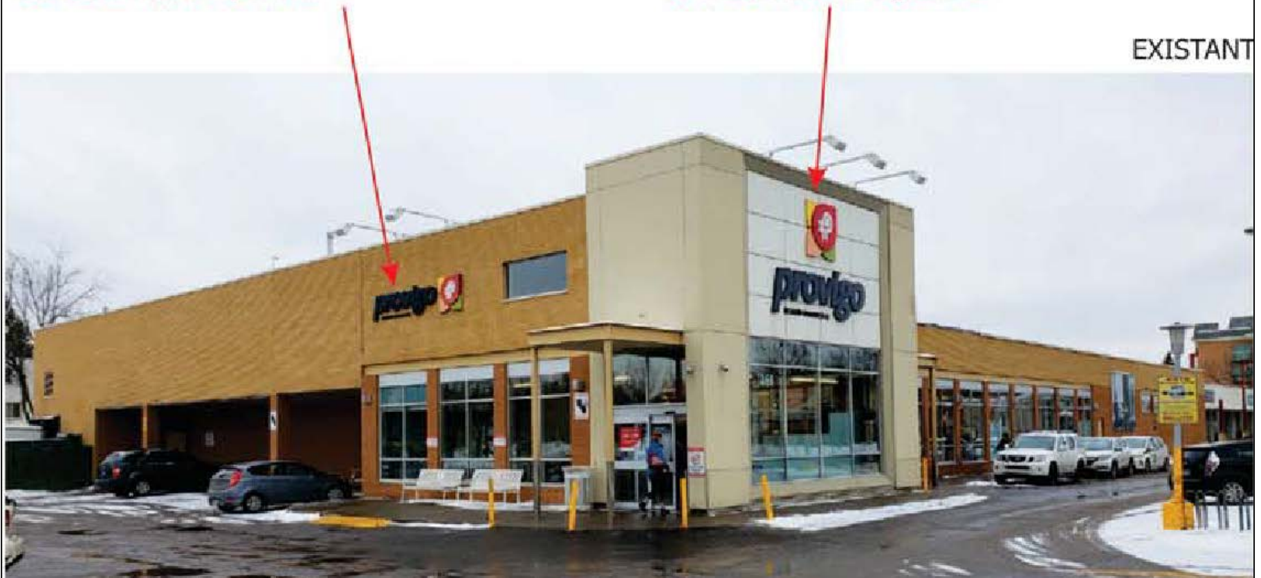
Photo du bâtiment existant