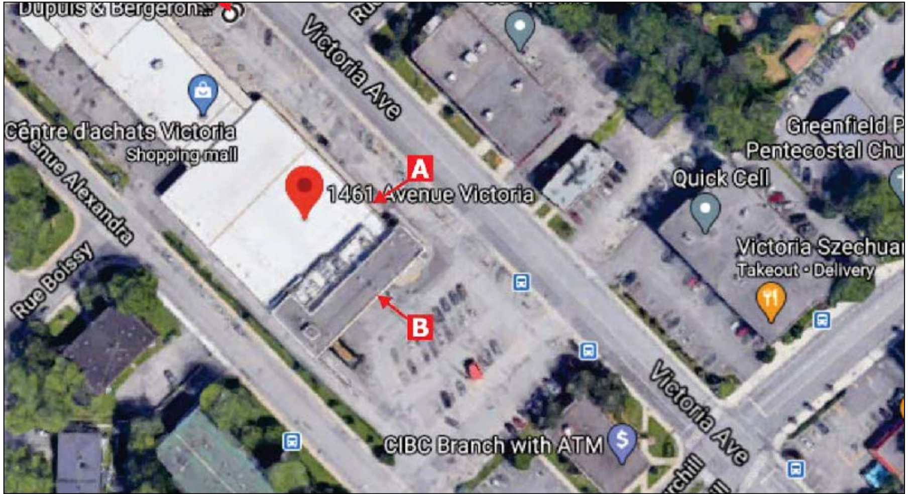
Emplacement des enseignes