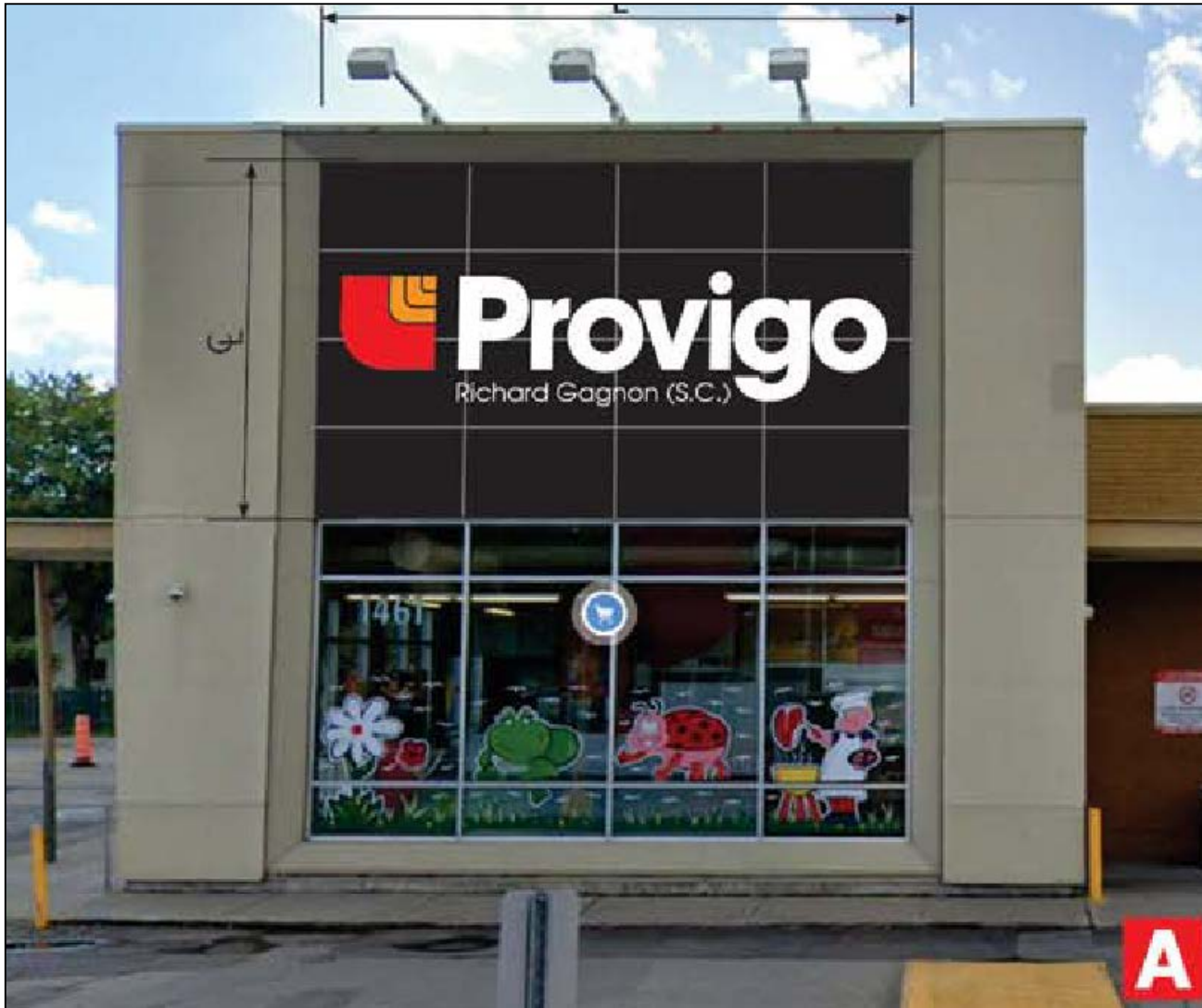
Photomontage – façade avenue Victoria