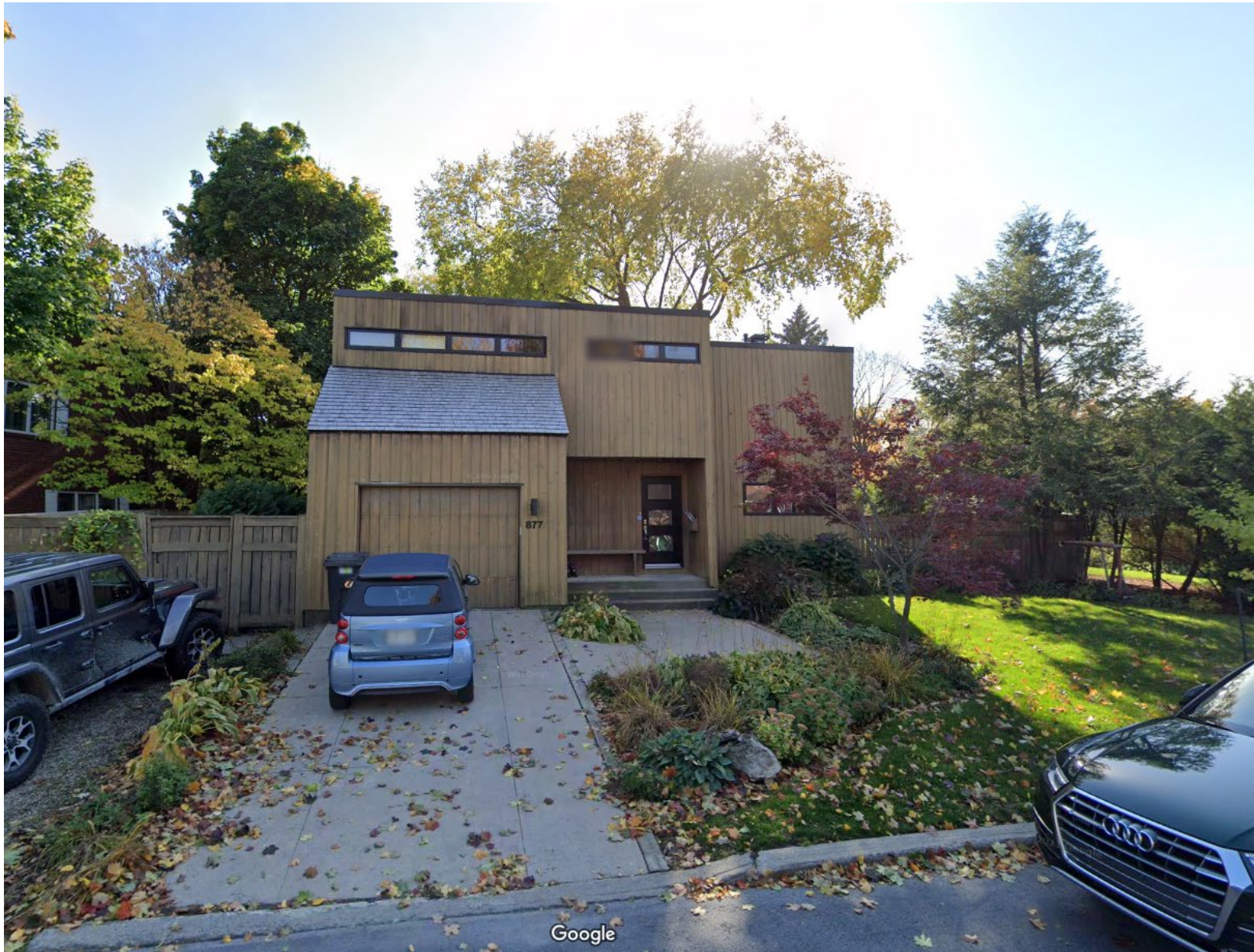
Façade avant existante