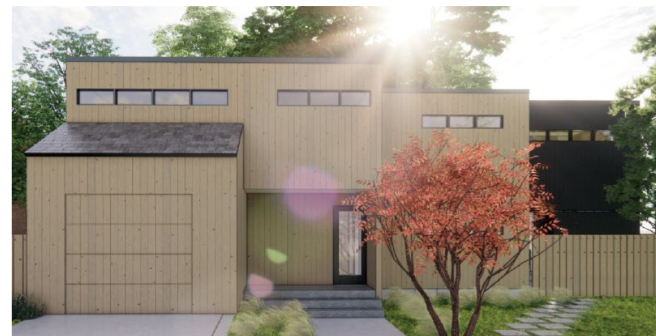
Proposition d'agrandissement avec un parement d'aluminium noir

Cette résidence est présentement revêtue de 2 matériaux; du bois de couleur beige et du métal peint de couleur noire (en cour arrière). La dérogation mineure vise une meilleure intégration avec le bâtiment existant en utilisant des lattes d'aluminium extrudées noires verticales. L'utilisation du bois a d'abord été envisagée, mais cela ne permettait pas de respecter les normes de matériaux incombustibles exigés par le Code de construction du Québec.