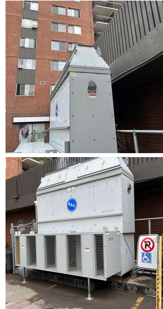
Appareil mécanique existant permis no 2022-00967