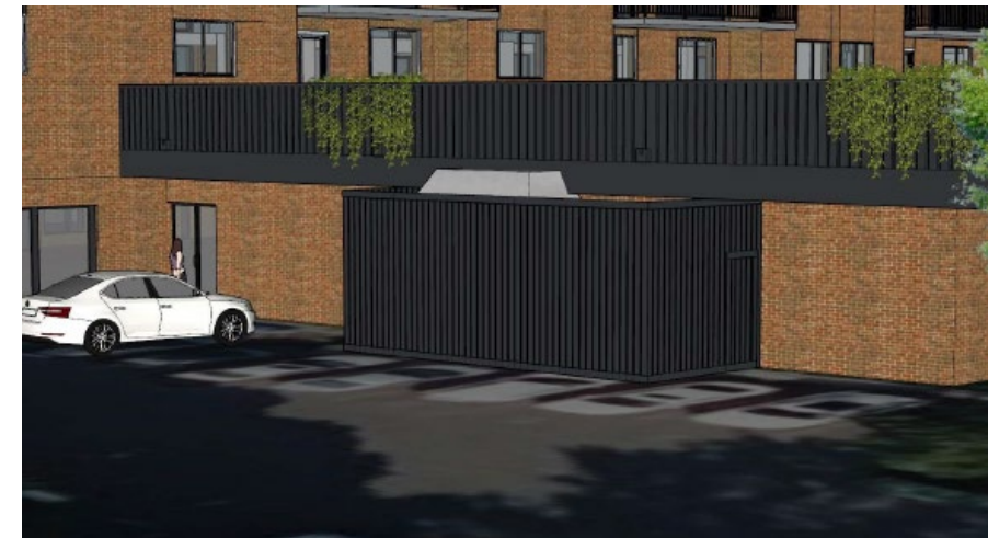
Écran visuel proposé, en bois, peint de couleur noir