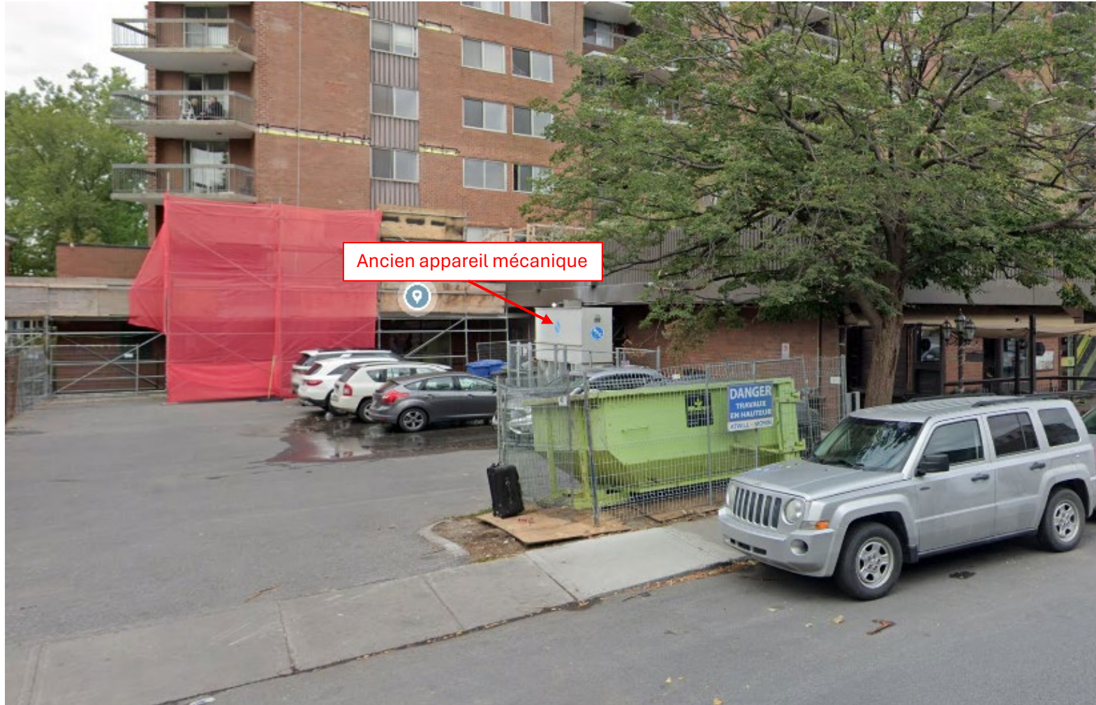
222 Woodstock, appareil mécanique en cour arrière