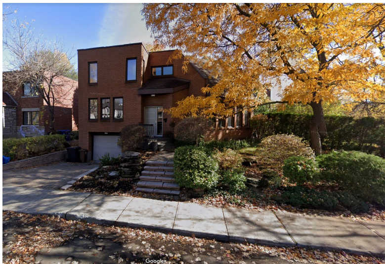
Façade boul. Desaulniers